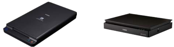
DIN A4 Flachbettscanner-Einheit 102