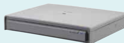
DIN A3-Flachbett-Scaneinheit 201