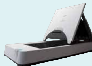
DIN A4-Flachbett-Scaneinheit 101

Scannen Sie Bücher, Zeitschriften und empfindliche Materialien mit der optionalen Flachbett-Scaneinheit 101 für Formate bis DIN A4 oder der Flachbett-Scaneinheit 201 für Formate bis DIN A3. Diese Flachbett-Scaneinheiten werden per USB verbunden und arbeiten problemlos (nur) mit dem DR-C225 zusammen, sodass für jeden Scanvorgang die gleichen Bildoptimierungsfunktionen zur Verfügung stehen.