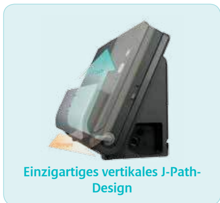
Einzigartiges vertikales J-Path-Design

Das J-Path-Transportsystem erlaubt die vertikale Zuführung von Dokumenten und spart so wertvollen Platz. Außerdem können beide Geräte dank der seitlichen Kabelanschlüsse direkt an einer Wand oder sogar in einem Regal aufgestellt werden.